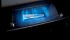
تبريد علبة القفازات