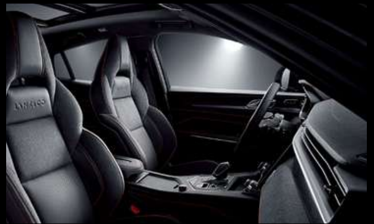
مقاعد رياضية فاخرة مدمجة