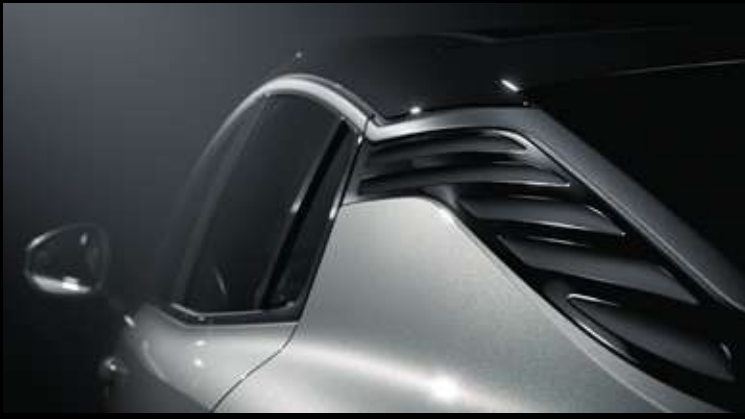
زخرفة ركائز أجنحة الشفق القطبي