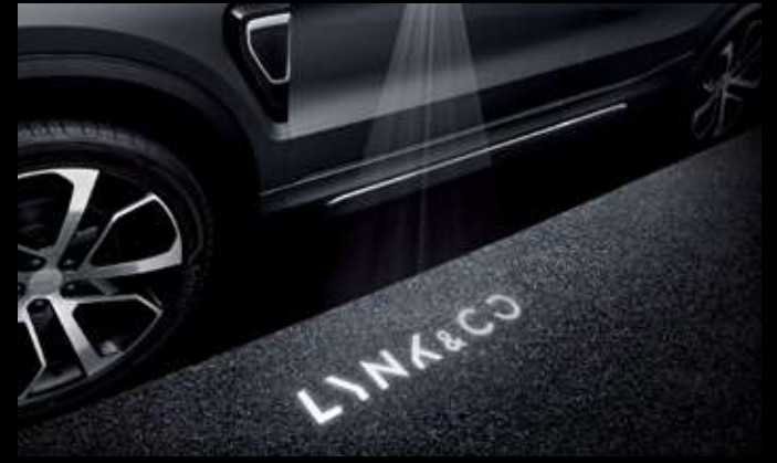
ضوء ترحيبي محيط