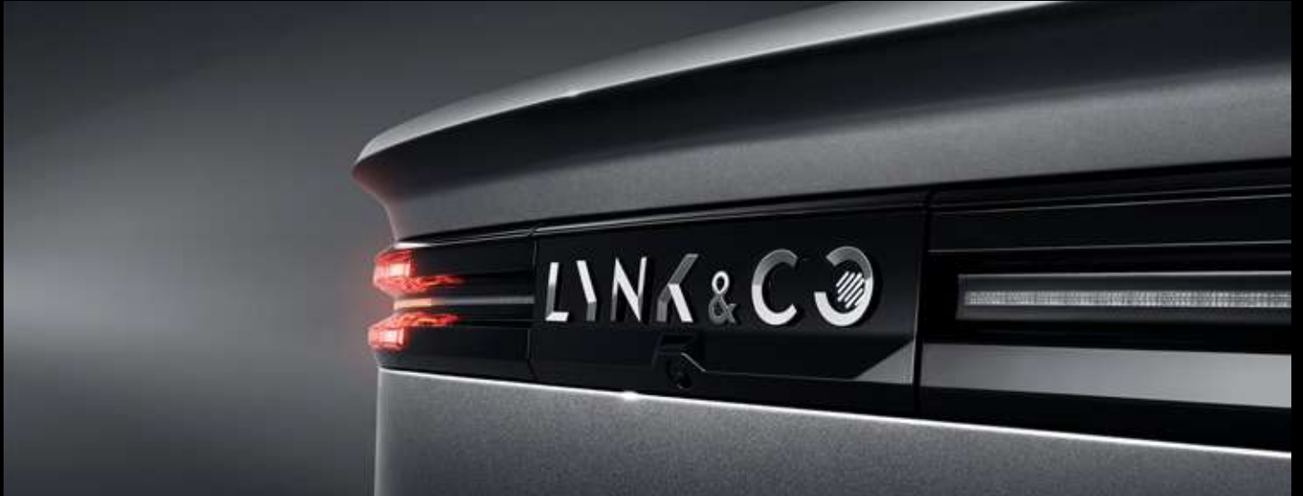
باب خلفي كهربائي يعمل باللمس بطرف الإصبع