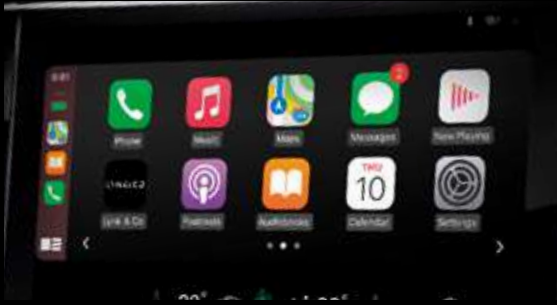
Apple CarPlay & Android Auto

يمكن التفكير في أكثر من واحدة. الجميع، هذا هو المعتاد عندي فحسب