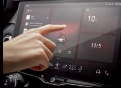
شاشة مركزية قابلة للمس قياس 12.7 بوصة