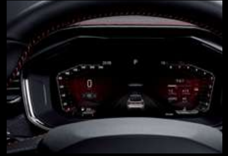
مجموعة عدادات رقمية عالية الوضوح قياس 12.3 بوصة