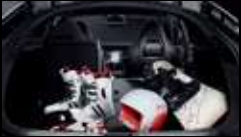
مساحة تخزينية عالية السعة