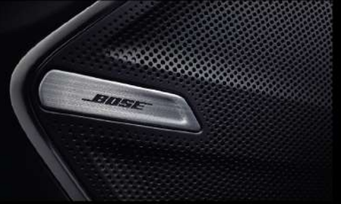
نظام صوت BOSE مع 14 مكبر صوت