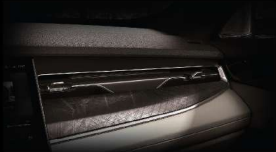
زخرفة من الألمنيوم