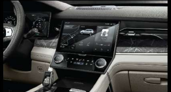
لوحة تحكم مركزية قابلة للمس بحجم 12+6 إنش