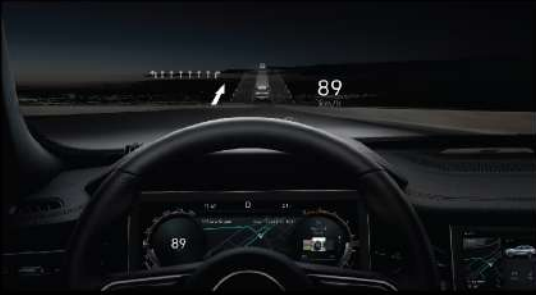
شاشة 12.8 إنش بتقنية W-HUD عالية الدقة

تقدم الواجهة الأنيقة تجربة ساحرة ومفعمة بالحيوية، تأخذك في عالم الانغماس والبدئية.